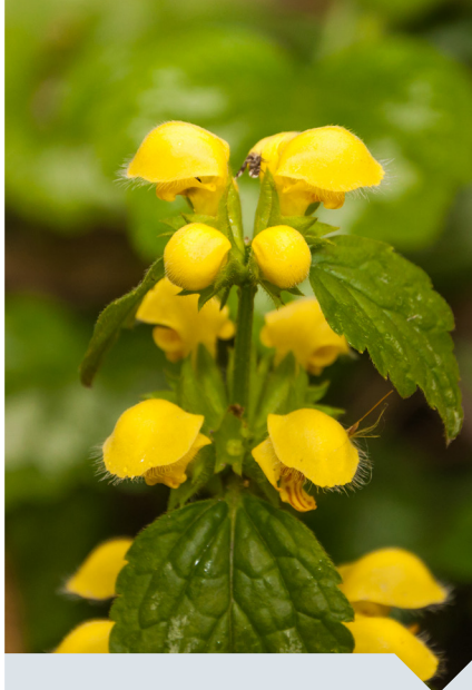
gele dovenetel Lamiastrum galeobdolon