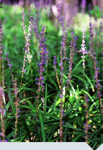
leliegras Liriope muscari