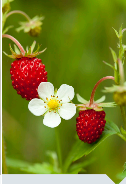
bosaardbei Fragaria vesca